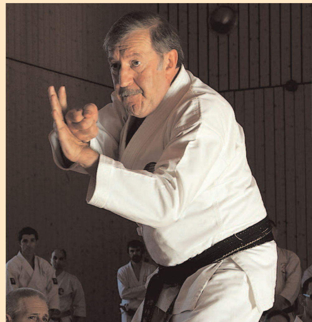
Ki-haku (projection de l'énergie) et Ki-seme (menace avec l'énergie).