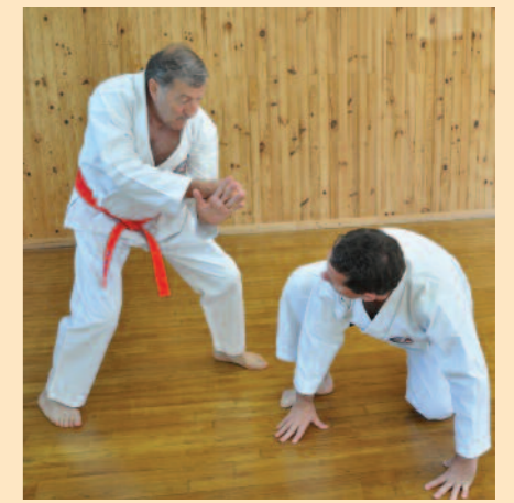
...que Uke contrôle de très près avant de considérer que la situation est sous contrôle.