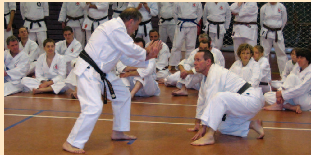
A l'entraînement, Tori adopte la position Inu-odoshi-no-shisei...

Le grand éducateur que fut Kano Jigoro, père du Judo, évoquait dans l'un de ses textes 5 deux enseignements fondamentaux qui doivent prévaloir dans un combat: d'abord Jukuryo-