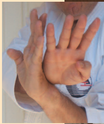
Teisho (protection, désescalade, contrôle)