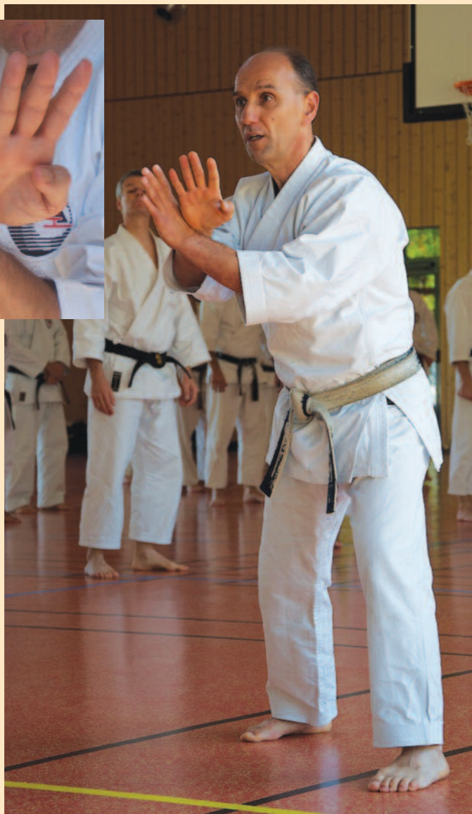
Tengu-no-kamae, à la fois garde (protection de soi) et mise en garde (élément de communication avec la menace).