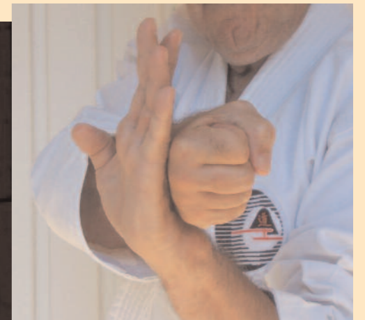
Tate-ken (menace, suivi, potentialité d'actions)

« Polis chaque technique, et surtout chaque comportement avec cette technique, comme une arme dont peut un jour, réellement, dépendre ta survie »